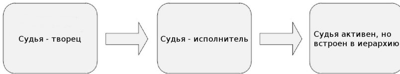
Рис. 2: Схематическое изображение эволюции судоустройства

жается активность судьи, он превращается в исполнителя. Для России иллюстрацией этого периода является вторая половина XX века, когда происходил переход от концепции непрофессионального народного судьи к судье-профессионалу. Суд становится частью государственного аппарата. Одновременно происходит порождение особой идеологии правосудия, которая слабо сочетается с реальной ситуацией. Все громкие декларации о правосудии — это следствие перехода между первым и вторым этапом. Порождается доктрина, которая скорее лакирует действительность, нежели отражает реальные механизмы. Нарастает диссонанс между практической деятельностью и декларациями. В какой-то момент теневой неформальный характер судебной механики начинает активно дискредитировать работу судов. Попытки исправить ситуацию с опорой на изначально неадекватную реальной практике доктрину приводят к парализации работы.